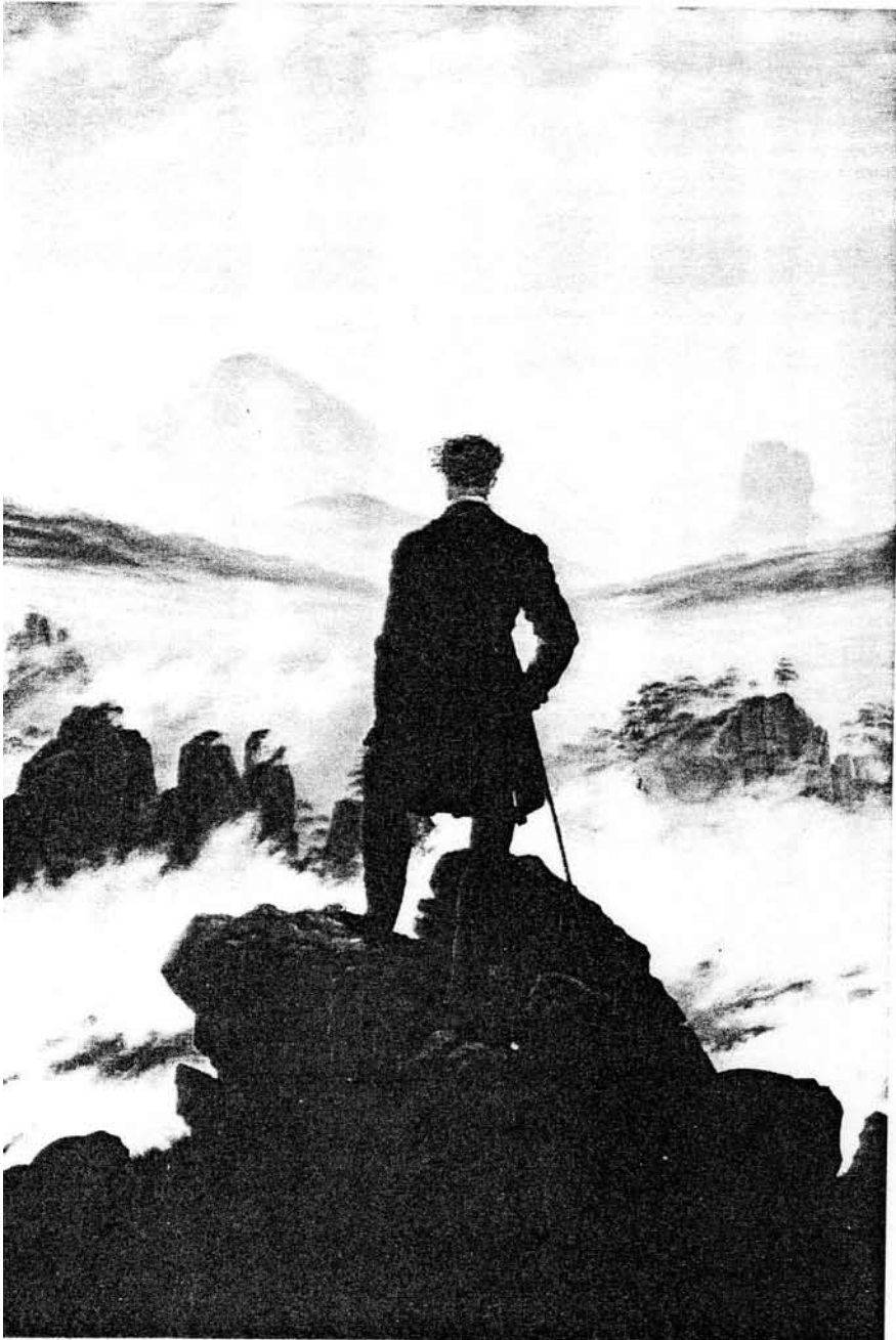
romantici ontwaarden drie kloven: tussen denken en voelen, tussen mens en natuur en tussen mens en de samenleving.'

h druk maakte om dergelijke thema's, wyl new age alle lagen van de maatschappij doordrenkt. Iedereen kan nu new age -tijdschriften en -boeken kopen. ik zie nog een ander verschil. De mens tussen een religieuze en een humanistische levensinstelling is in de new age wel zéér poreus geworden. Dat gold ook al een beetje voor de romantiek. De voor Hugo kon van een orthodoxe katholicus veranderen in een vrijdenker, en Friedrich Schlegel werd van een ongelovige tot een gelovige, zonder dat deze romantici zelf vonden dat zij in hun levenswijze een carrière ... werkelijk van gedaante waren veranderd. Maar tegenwoordig is het behoorlijk moeilijk om